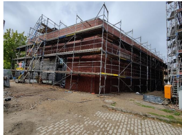
Fotos Baukörper Neubau Haus 6000 Kfz- und Karosseriewerkstatt